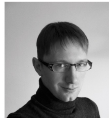
projekt: arch.wnętrz Damian Piłat